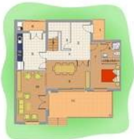
PLANTA BAJA SUP. CONSTRUIDA COMISSA 908 SUP. PORCHES 2143+14 90 TOTAL SUP. CONSTRUIDA P. SAU 18,27 m 2

C/. Sant Joan, 74 – 07440 – Muro – Illes Balears Mòbil. 636 166 453 www.dibujamos-tus-ideas.com e-mail: info-dib-@dibujamos-tus-ideas.com