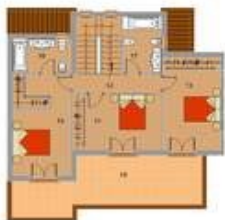
PLANTA PRIG MURA SUP. CONSTRUIDA P. SAU 18,27 m 2